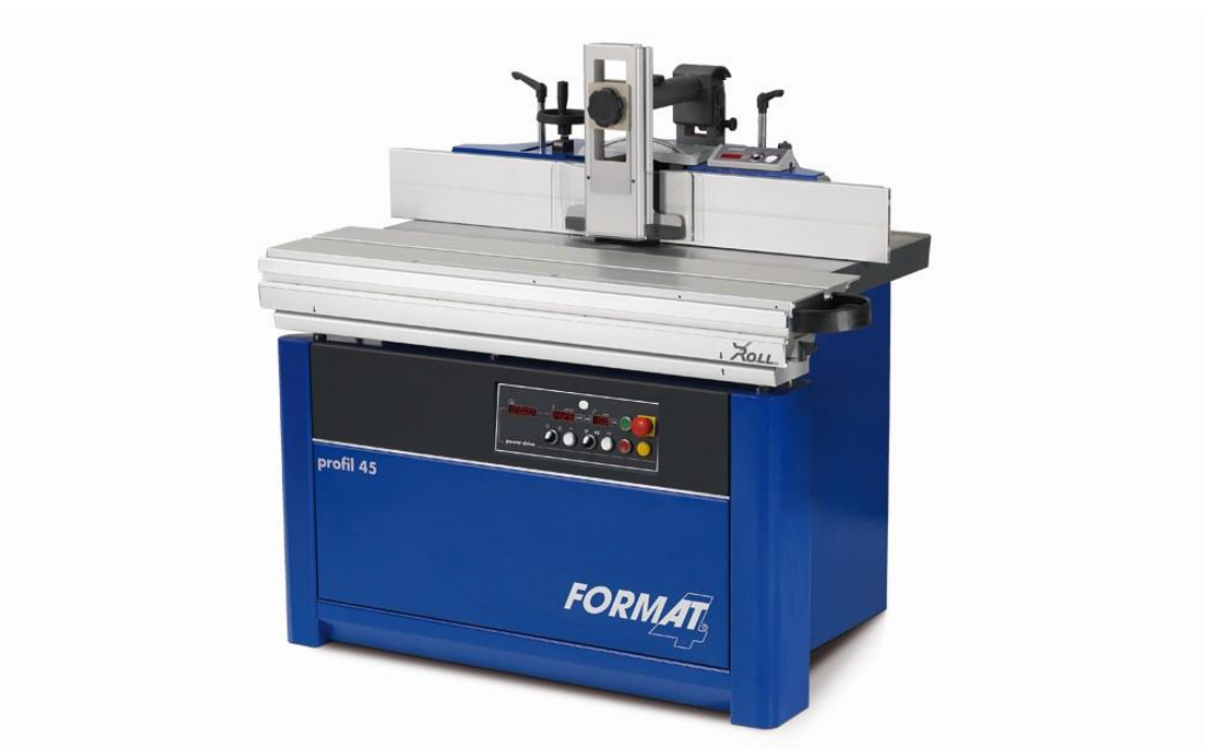
Vyobrazení s optimální výbavou.

Souhrn výhod - vysoký výkon, bezkonkurenční komfort obsluhy a jedinečné technické detaily