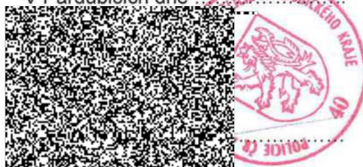
ředitel krajského ředitelství policie