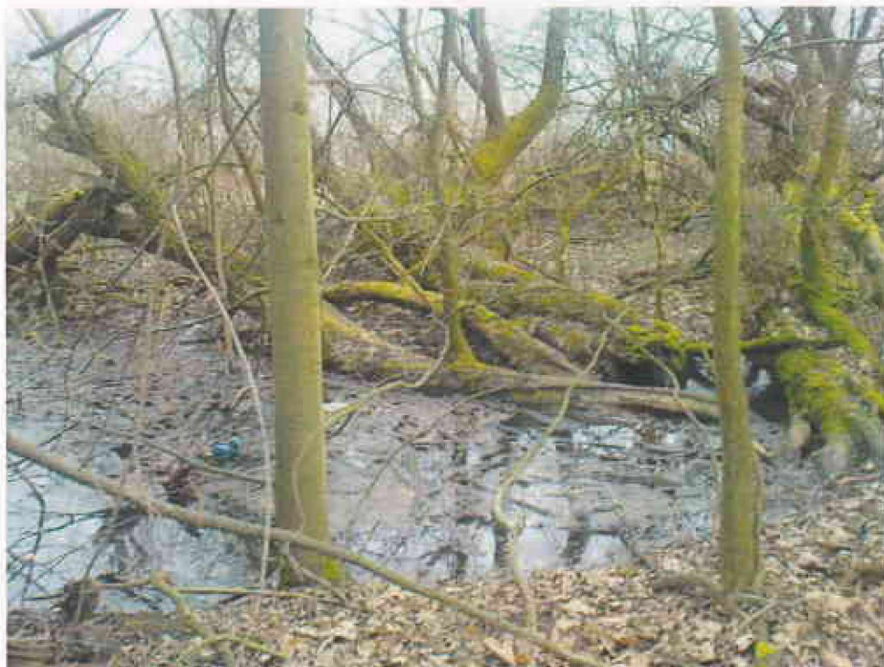
Obr. 7 - Stromy spadlé do koryta pod objektem FO 5