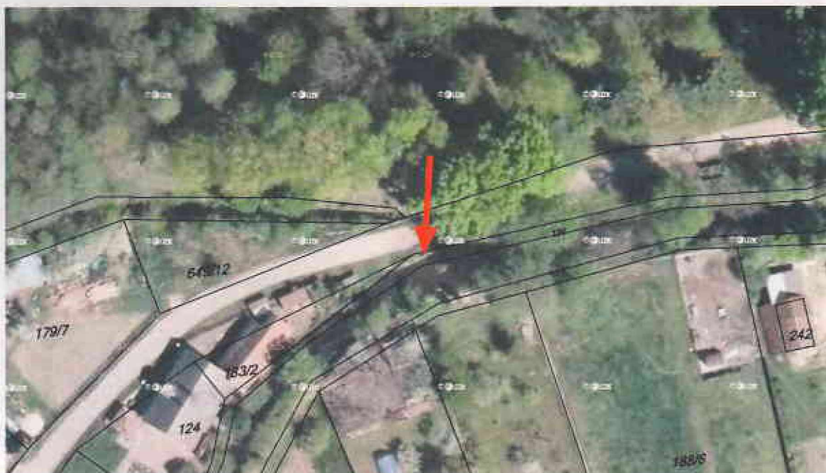
Obr. 1 - Situace funkčního objektu č. 1 na podkladě katastrální mapy (k.ú. Semín)