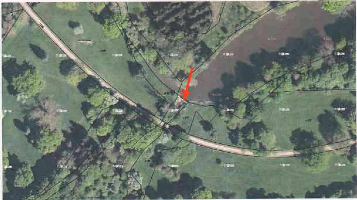
Obr. 3 - Situace funkčního objektu č. 6 na podkladě katastrální mapy (k.ú. Kladruby nad Labem)