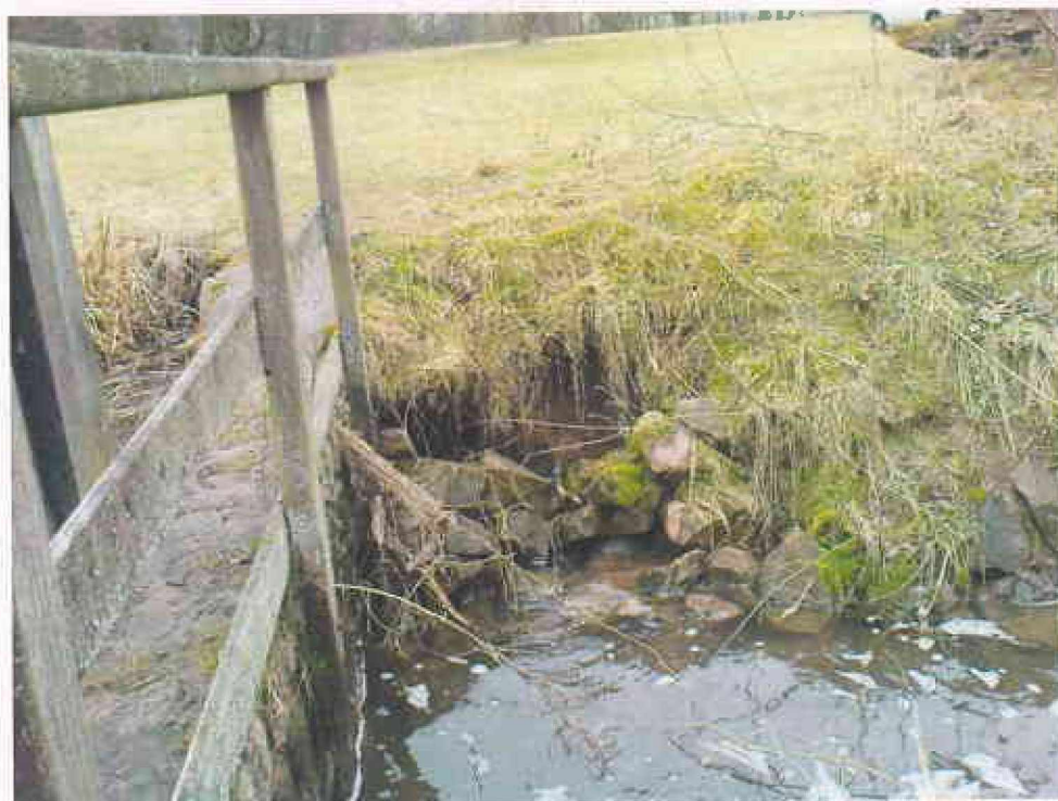
Obr. 10 - Podemletý práh na vzdušné straně objektu FO 6 – levá strana objektu