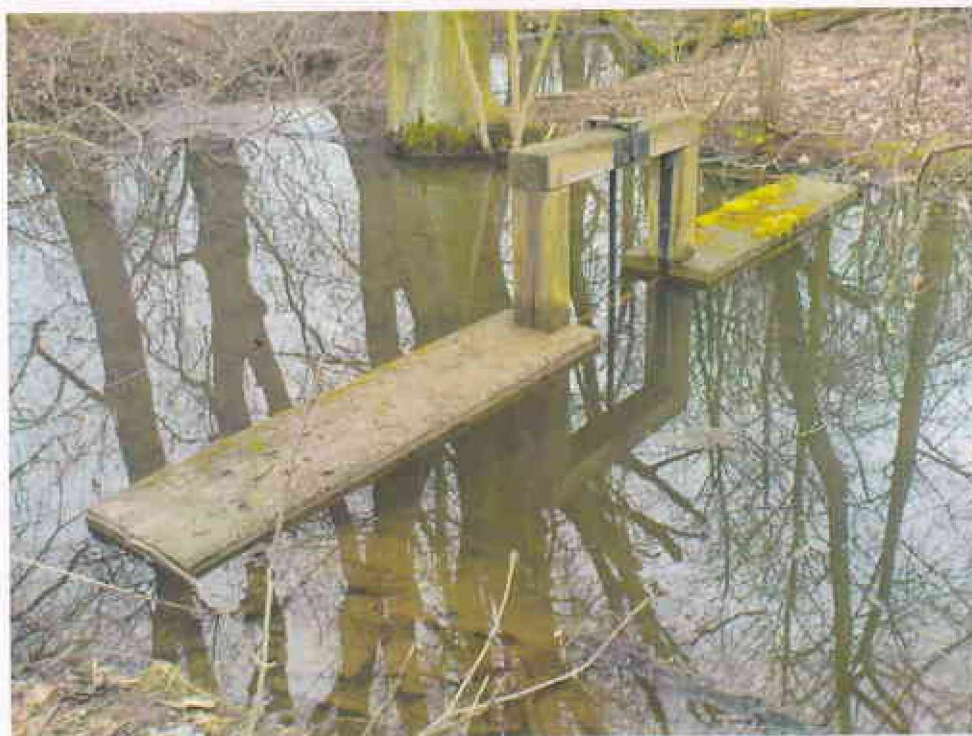
Obr. 6 - Stav objektu FO 5, zvýšenou hladinu vody způsobují spadlé stromy v korytě viz obr. 7