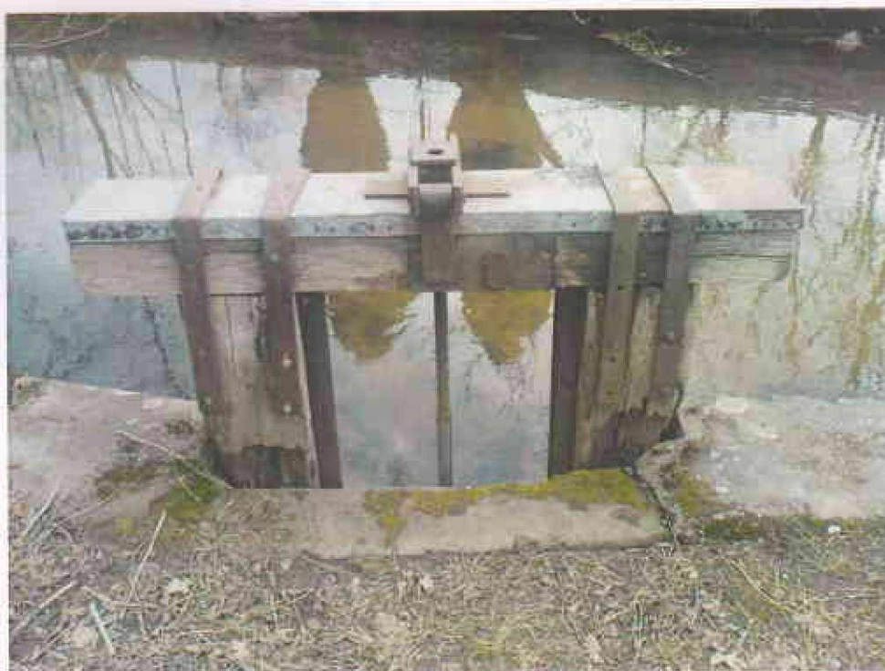
Obr. 5 - Pohled od místní komunikace na objekt FO 1 (stavidlo), ve spodní části je patrné poškození dřívků