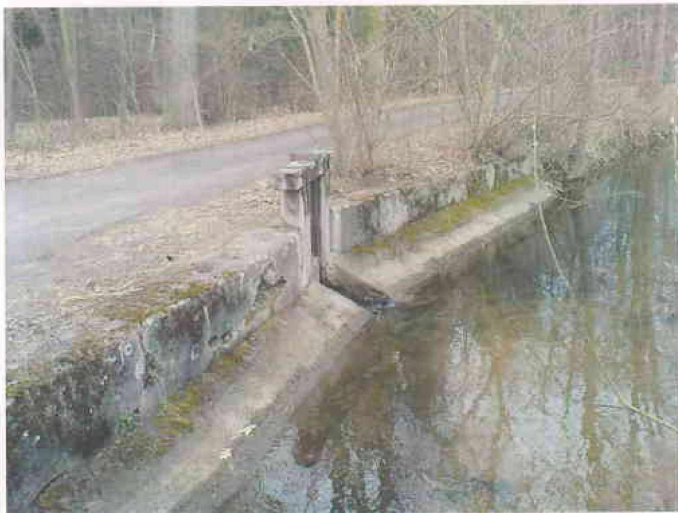
Obr. 4 - Umístění objektu FO 1 v korytě Opatovického kanálu