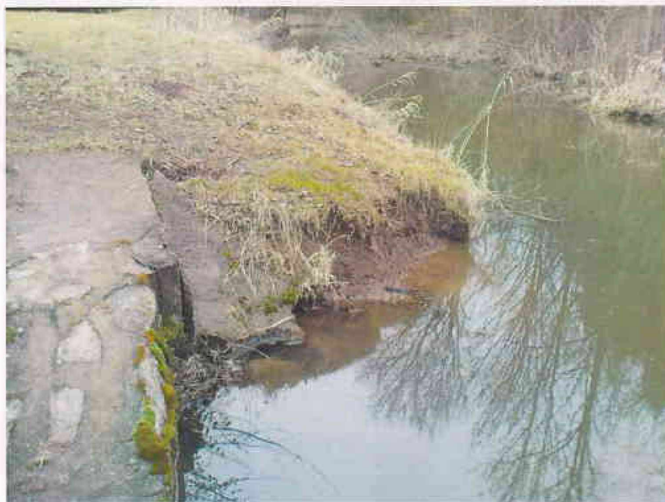
Obr. 8- Poškození neopevněného břehu na návodní straně objektu FO 6 – pravá strana objektu