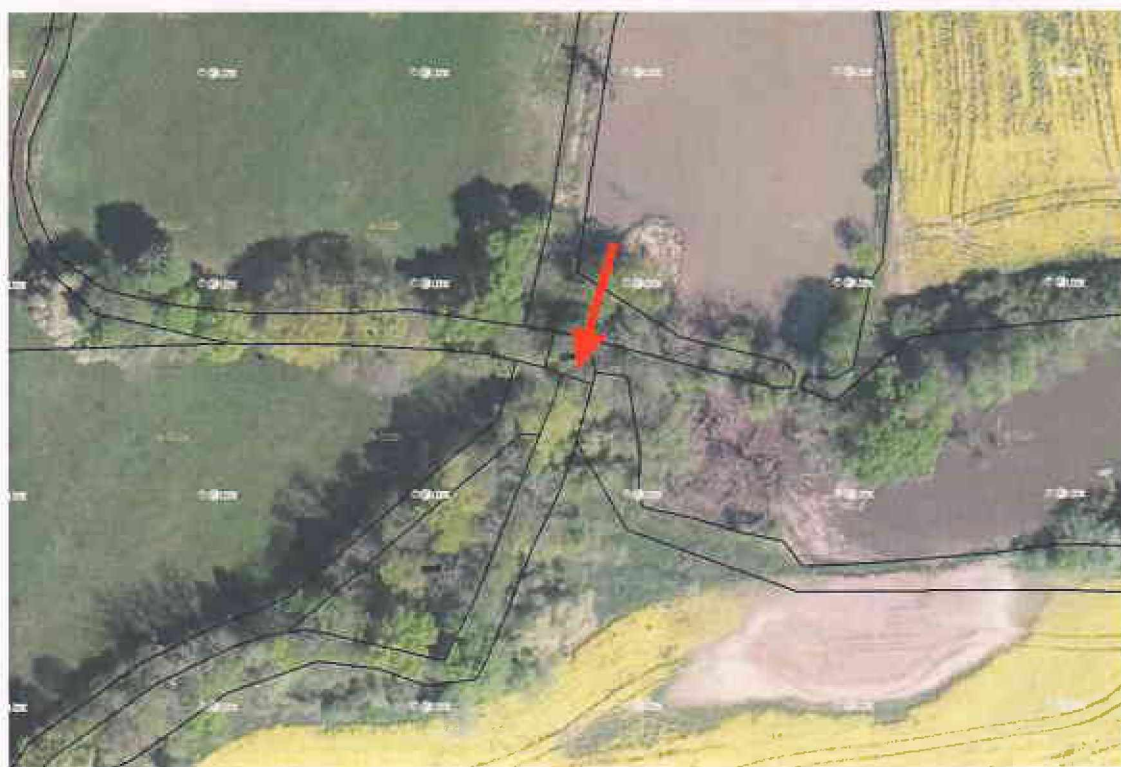
Obr. 2 - Situace funkčního objektu č. 5 na podkladě katastrální mapy (k.ú. Kladruby nad Labem)