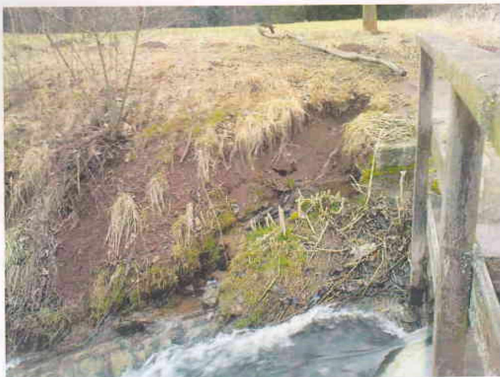
Obr. 9 - Podemletý práh na vzdušné straně objektu FO 6 – pravá strana objektu