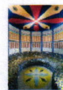
30 VOLAREZA Bedřichov parní solná sauna