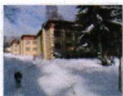
3 VOLAREZA Bedřichov - depandance zima