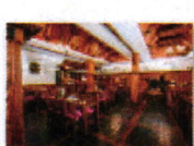
20 VOLAREZA Bedřichov - U Medvěda interier