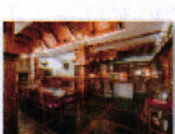
21 VOLAREZA Bedřichov - U Medvěda interier