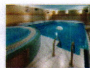
24 VOLAREZA Bedřichov Vodní ráj