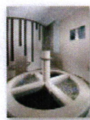
34 VOLAREZA Bedřichov Kneippův chodník