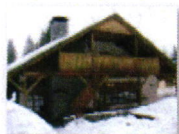
19 VOLAREZA Bedřichov - restaurace U Medvěda