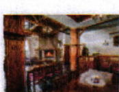
22 VOLAREZA Bedřichov - U Medvěda interier