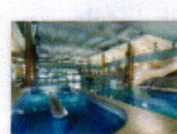
23 VOLAREZA Bedřichov Vodní ráj