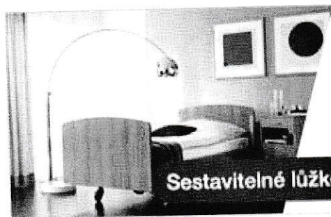
Sestavitelné lůžko Movita 2-d

[redacted] LINET spol. s r.o., Zelevčice 5, 274 01 Slaný