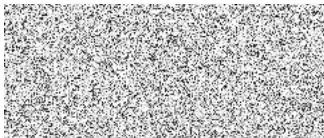
statutární ředitel za zhotovitele