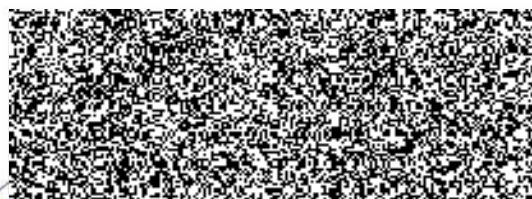
manažer, VTA na základě pověření (O2 Czech Republic a.s.)