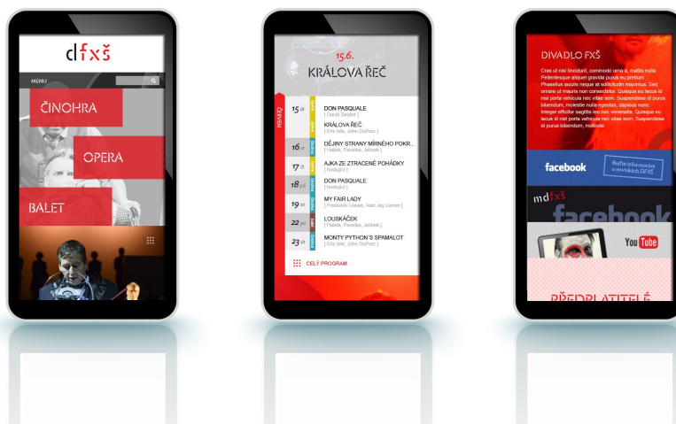
Zobrazení na tabletu Zobrazení na mobilních telefonech

Mezi další nekomerční reference patří bonusové stránky pro Střední průmyslovou školu textilní v Liberci a spolupráce s chráněnou dílnou Sdružení TULIPAN. Níže posíláme kontakty na jednotlivé subjekty kvůli možnému poreferování o průběhu zakázky a přístupu naší společnosti: