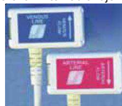
H4FX průtokové / diluční senzory