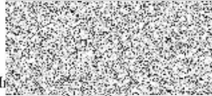
Ing. generální ředitel