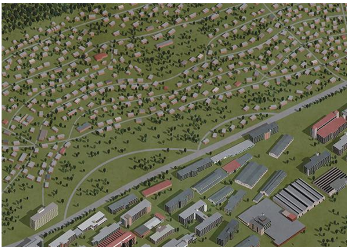
Příklad výtvarného zpracování tématu Zlín (xxxxxxxxxx)