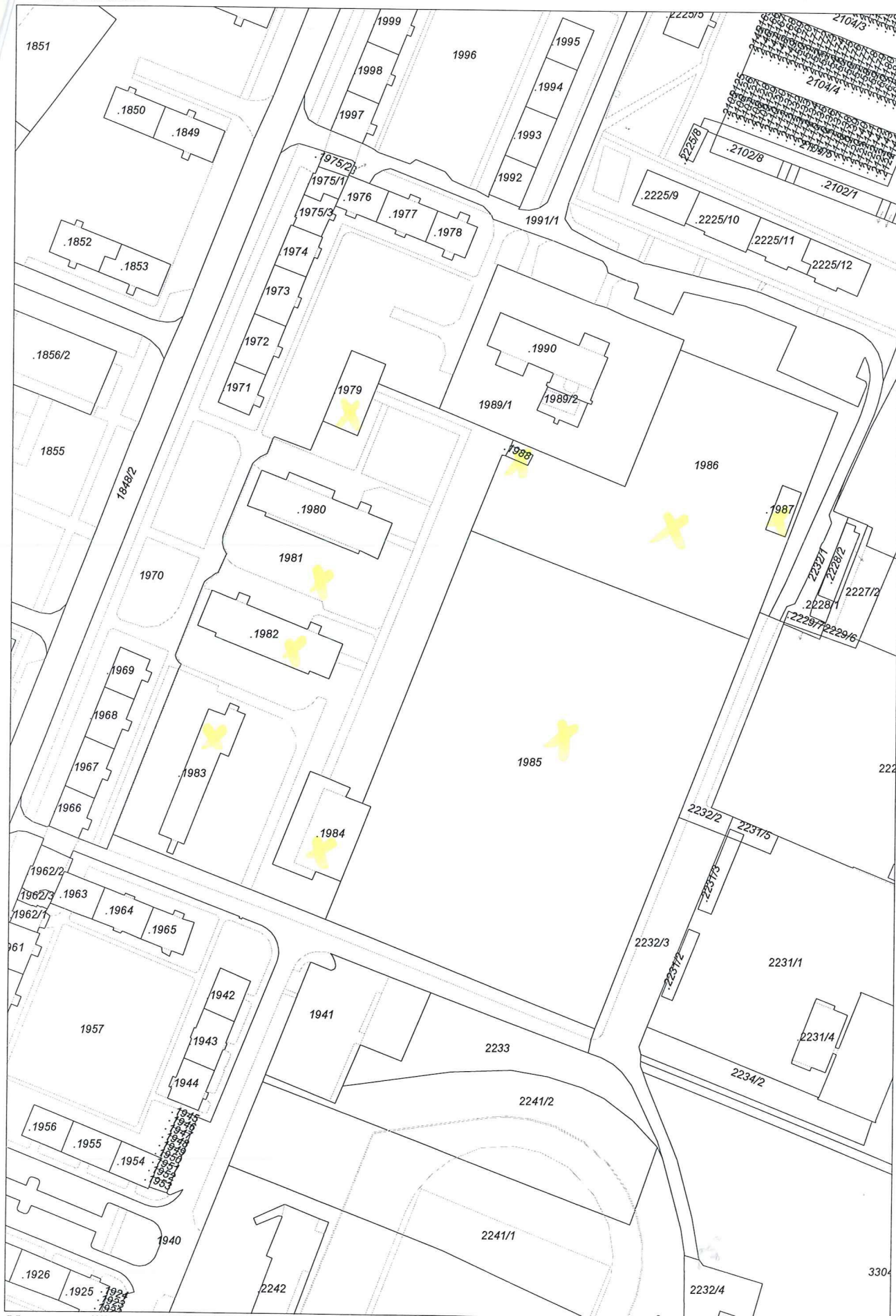
Mapa v měřítku 1:1762