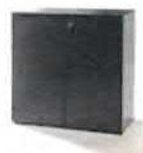
Skříňka uzamykatelná 580 Kč