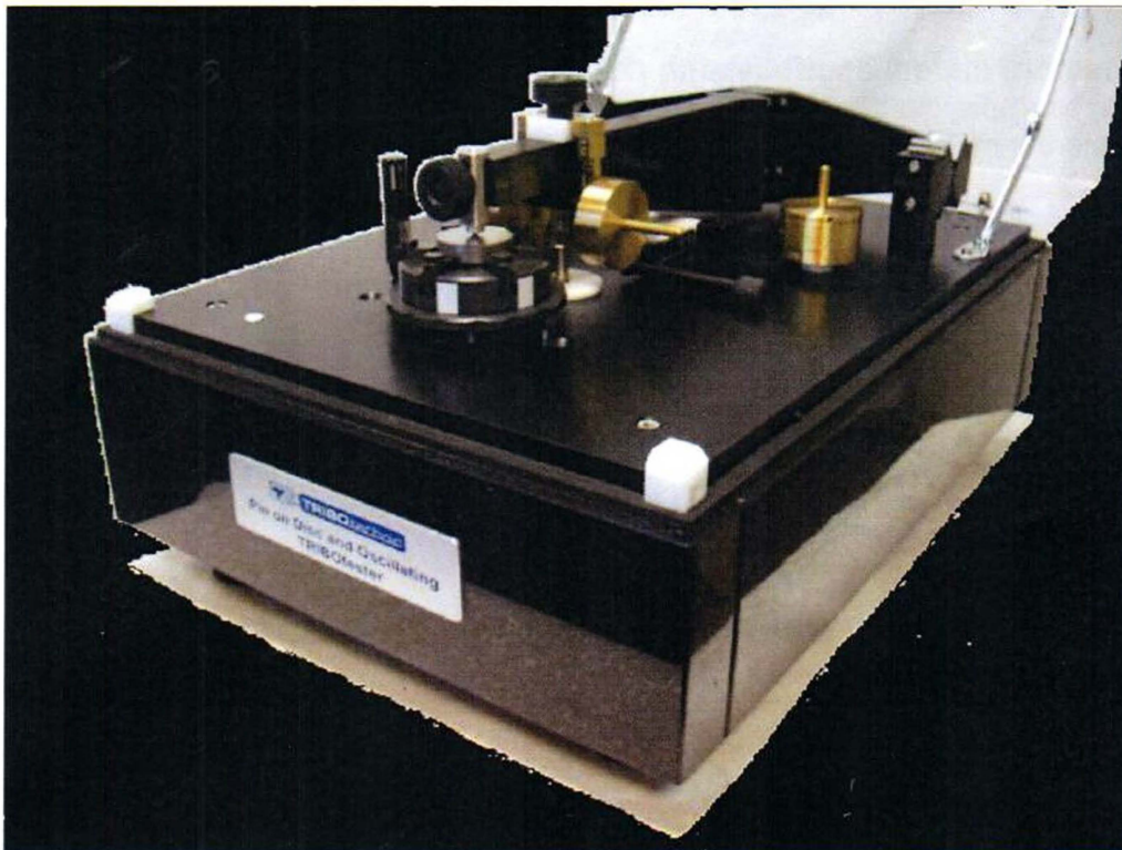
Ilustrační foto základního modulu