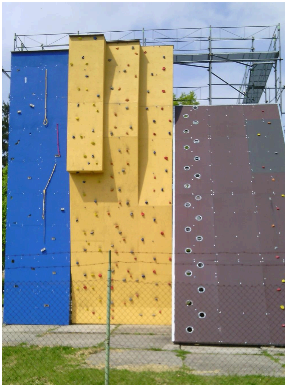
Foto: Lezecký model JAKUB