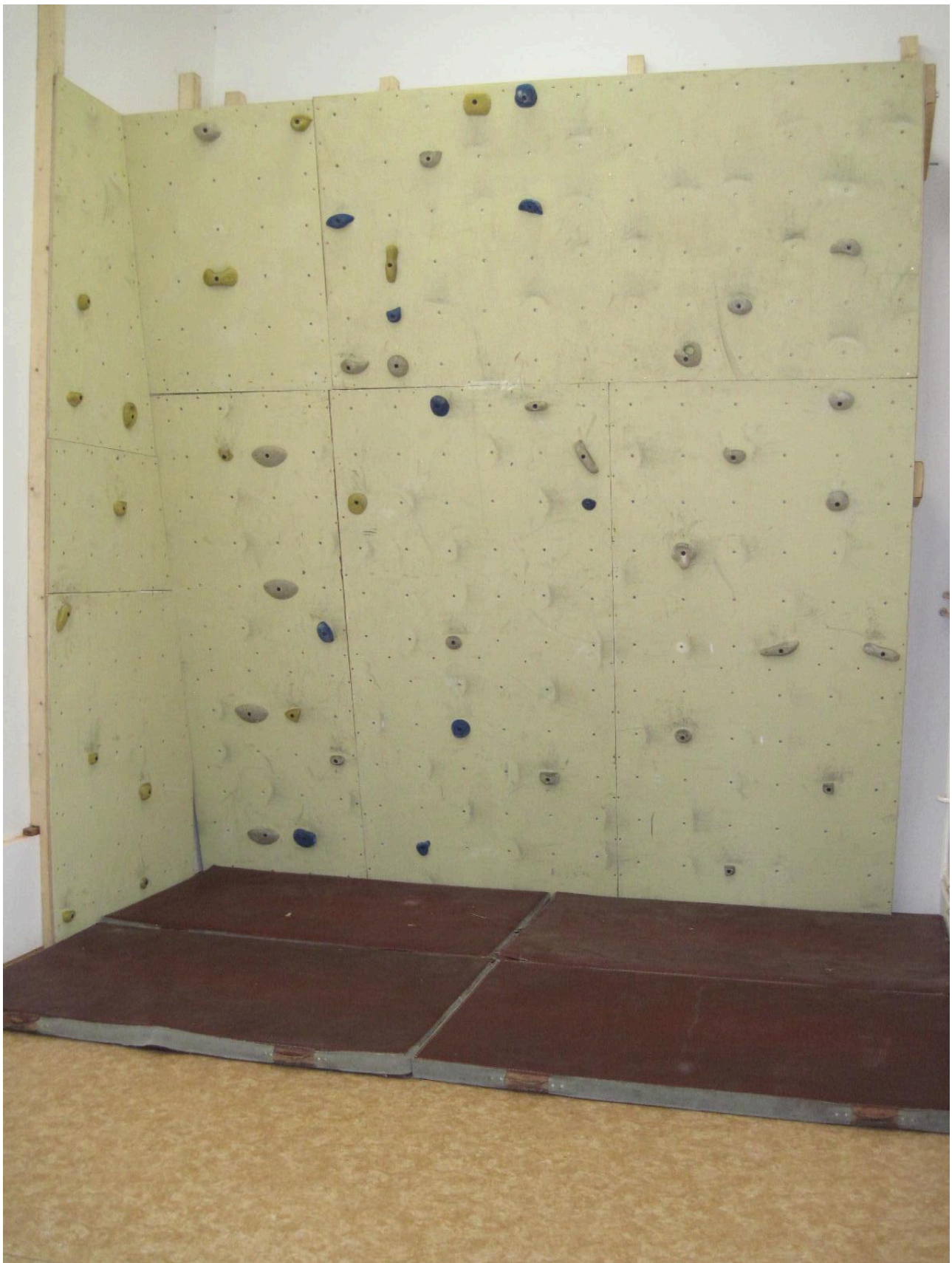
Foto: vnitřní lezecká stěna