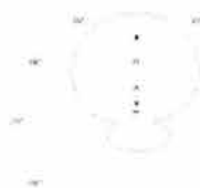
Vyzařovací diagram v rovině H