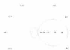
Vyzařovací diagram v rovině E

Výrobce: RCD Radiokomunikace spol. s r. o. Staré Hradiště 26, 533 52 Pardubice Česká republika