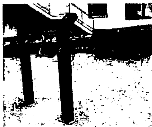
Barevné provedení sloupků RAL5015