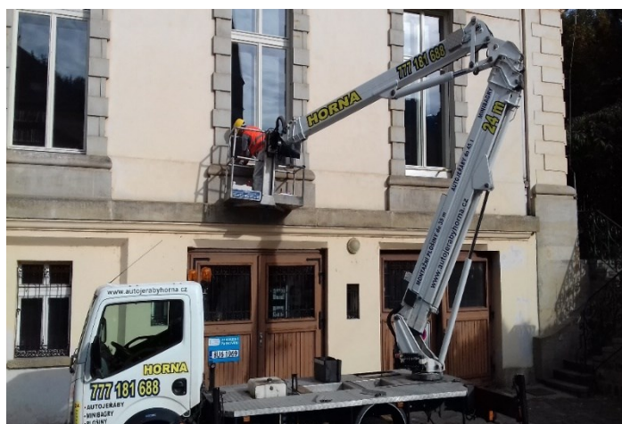
Oblepení hran u spáry