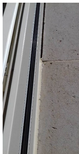
Porovnání zatmelené a nezatmelené spáry