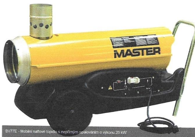
BV77E - Mobilní naftové topidlo s nepřímým spalováním o výkonu 20 kW

MASTER BV 77E – napětí 230V/50Hz, výkon 20kW, proud 1,5A, palivo nafta, objem nádrže 36ltr (tzn. 20 hodin provoz) , průtok vzduchu 1550 m 3 /hod, hmotnost 32kg, rozměry 120x40x53 cm. Tepelný rukáv 3m, pr. 30cm. Prostorový termostat je součástí.