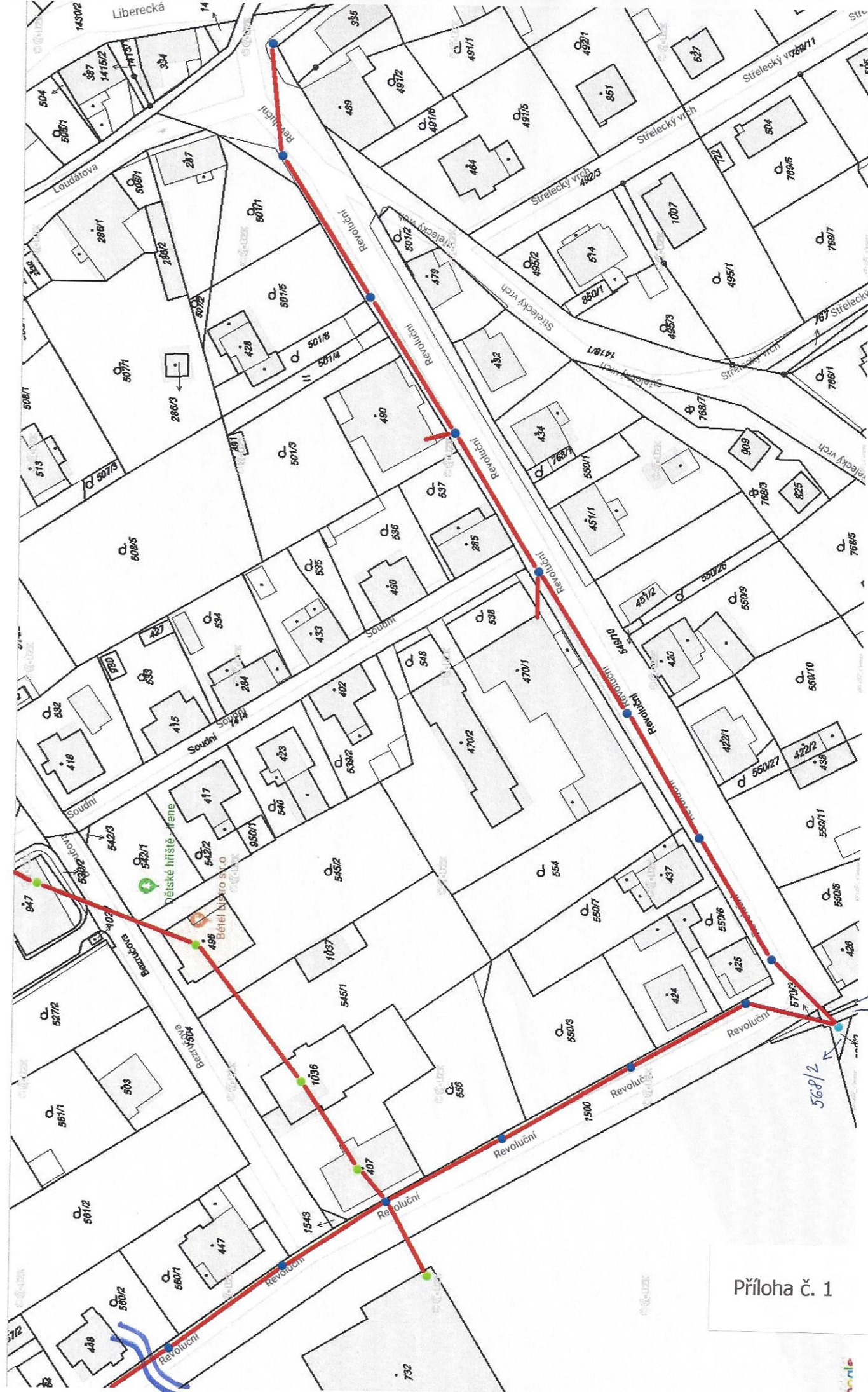
Příloha č. 1