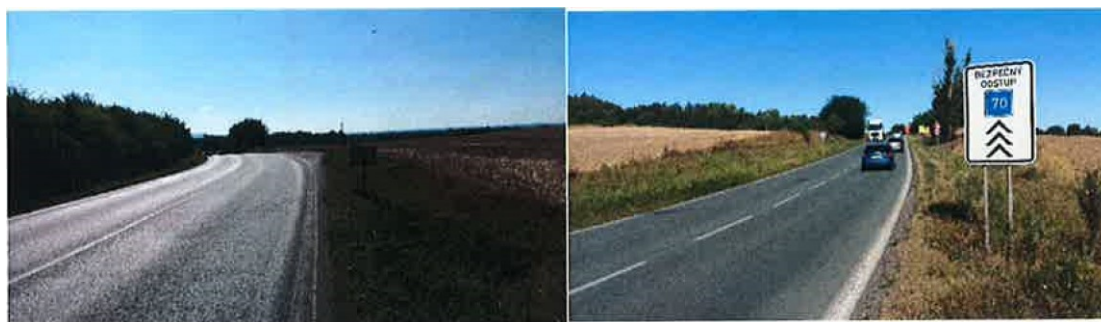
Foto 3 -Zaslepená historická I/38