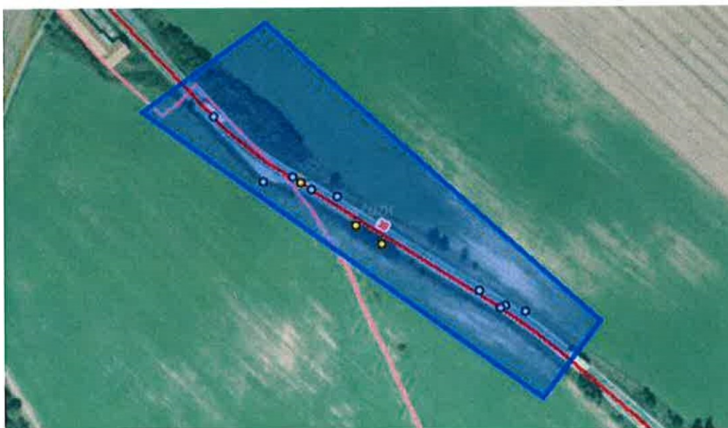
Foto 5 — místa dopravních nehod 2007-2015