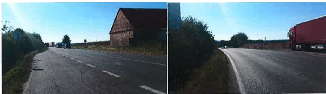
Foto 1- pohled od křižovatky na Hlízov Foto 2 — Odstavený kamion na zaslepené původní komunikace I/38