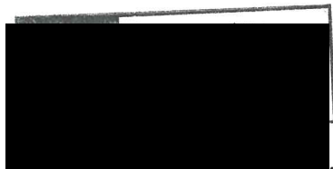
K srdci klíč, o.p.s.