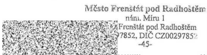
Mgr. Zdeňka Leščištinová starostka města