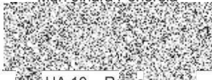
PRAHA 10 - Rekreační a.s. Mgr. Stanislav Šandáček

PRAHA 10 - Rekreační, a.s. Vršovická 68/1429 101 38 Praha 10 - Vršovice IČO: 282 13 983