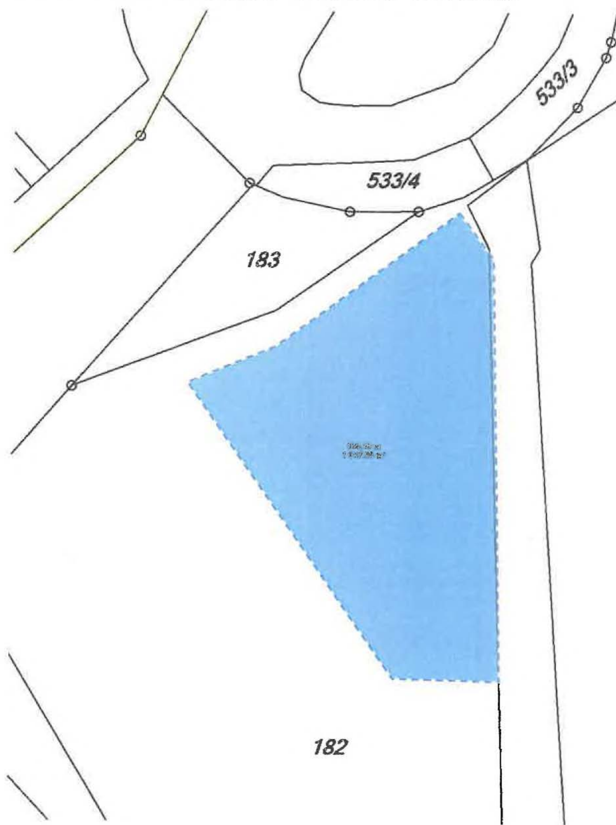
Příloha - situace vymezení části pozemku parc.č. 182, k.ú. Sedlec v katastrální mapě