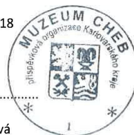
ředitelka Muzea Cheb, p. o. Karlovarského kraje