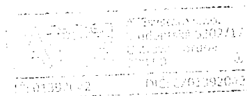
ATEsystem s.r.o. Petr Bilík