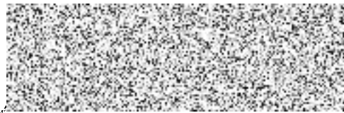
Martin Draxler, radní pro oblast regionálního rozvoje, cestovního ruchu a sportu

SKP OLYMPIA Střelecká 617 284 01 KUTNÁ HORA