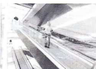
Eskalátory & pohyblivé chodníky