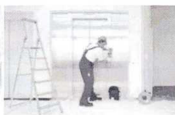
Servis 24 hodin