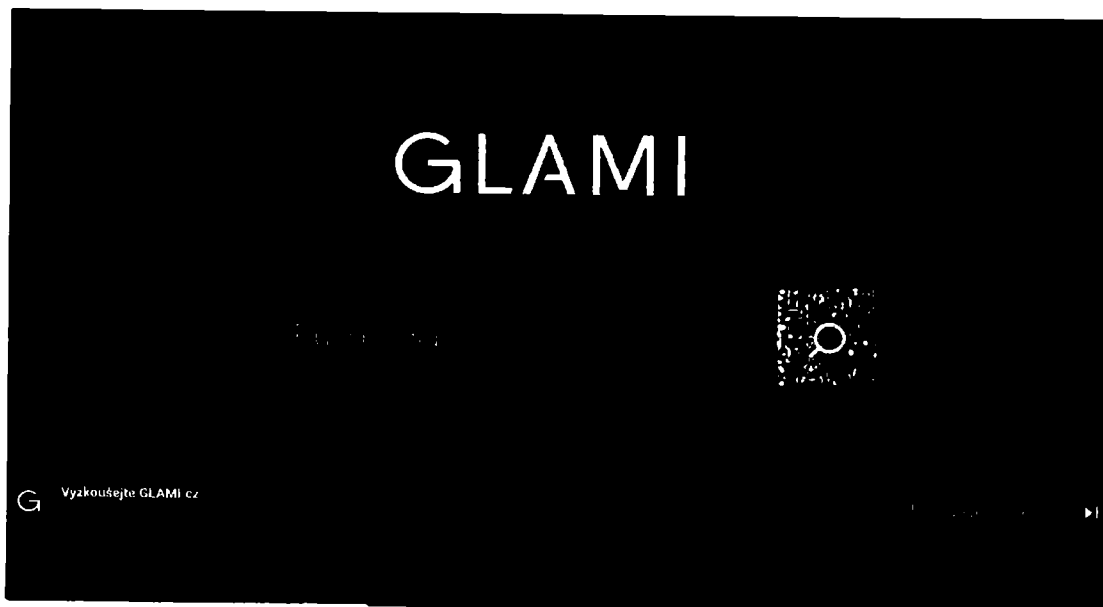
Ed Sheeran - Shape of You (Official Video)