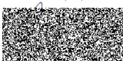
jednatelka Plzeňské stravování s.r.o. (Dodavatel)