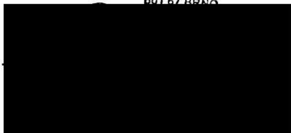
vedoucí Odboru investičního Magistrátu města Brna

STATUTÁRNÍ MĚSTO BRNO MAGISTRÁT MĚSTA BRNA Odbor investiční Kounicova 67 601 67 BRNO