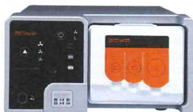
SHE SHA odsávač kouře