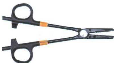
TissueSeal PLUS ligační kleště