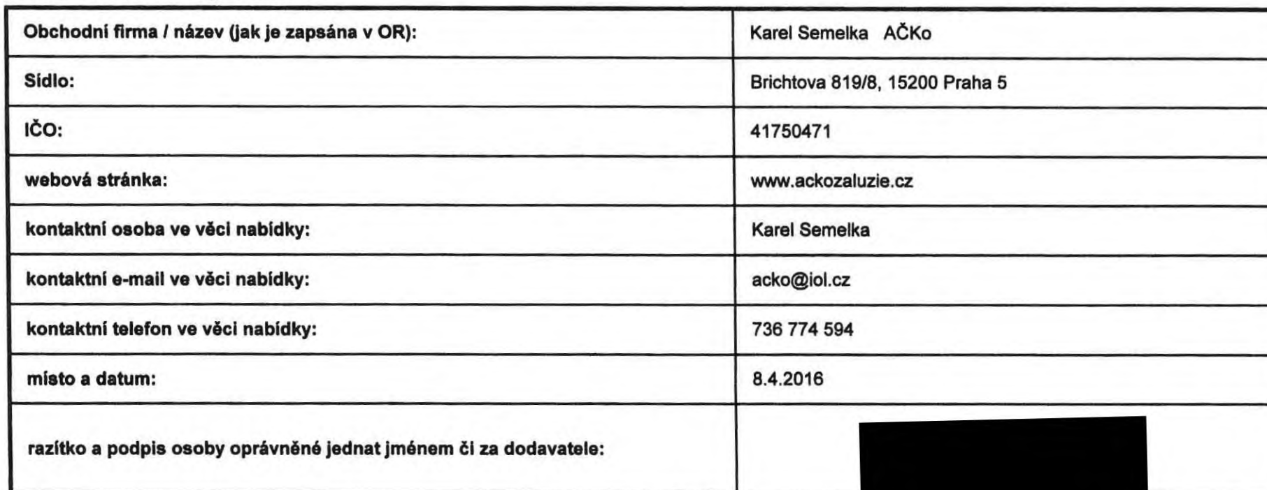
Tab. 2 - Identifikační údaje dodavatele