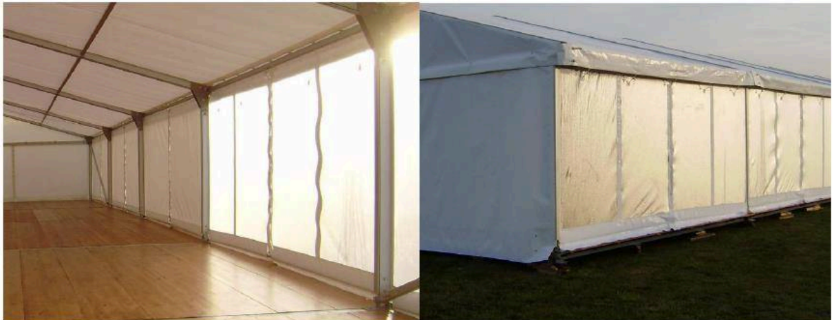
Možnost variability – definování průhledných či plných bočních stěn (rok 2013).