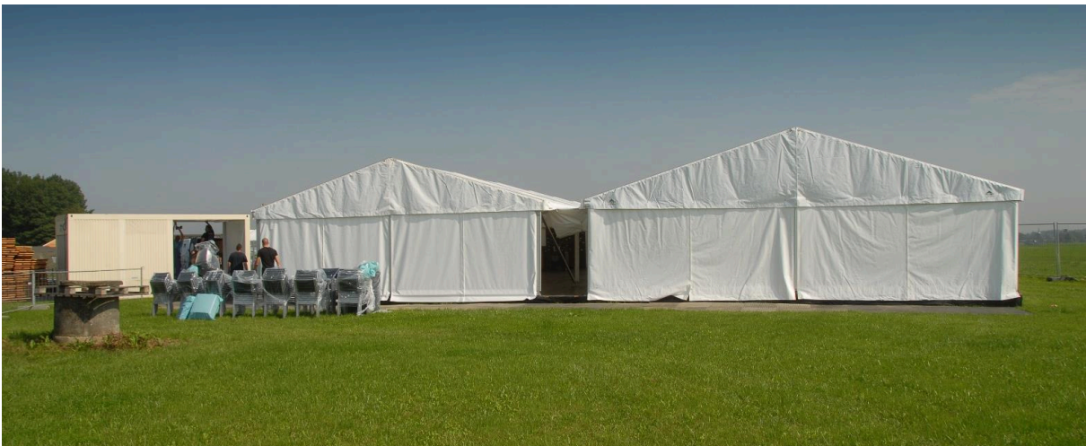
Čelní pohled na stan (rok 2014).