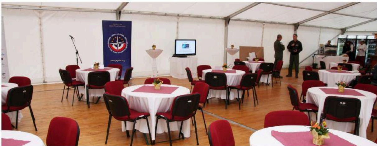
Vnitřní prostor stanu s vybavením (rok 2013).