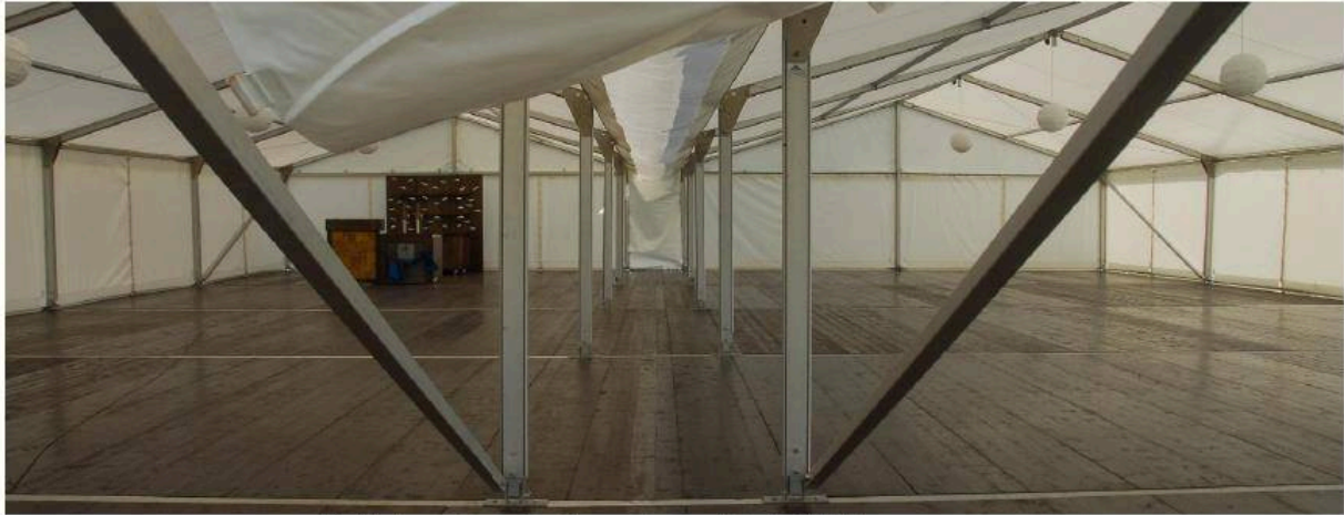
Vnitřní prostor stanu bez vybavení (rok 2014).