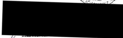
Judo klub -- N 62, z.s. [Redacted] – předseda spolku