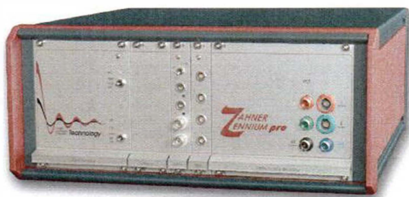
Obr. 1. Ilustrační obrázek systému Zennium Pro