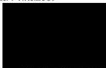
Olomoucký kraj Mgr. Jiří Zemánek 1. náměstek hejtmána