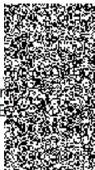
Mgr. .... Poloczek E. .... ředitel