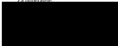
Nemocnice Havlíčkův Brod, příspěvková organizace