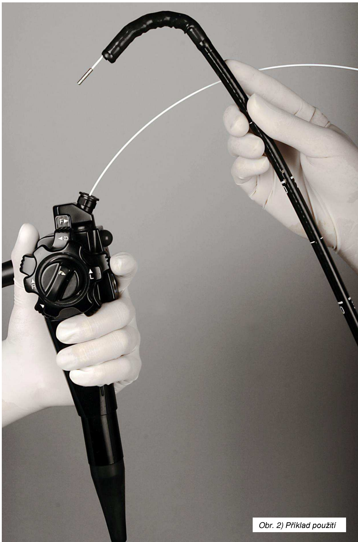
Obr. 2) Příklad použití