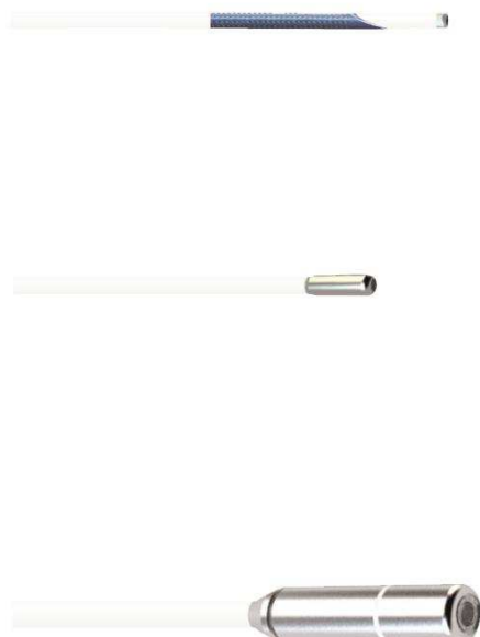
Obr. 4) Příklady sond pro GIT