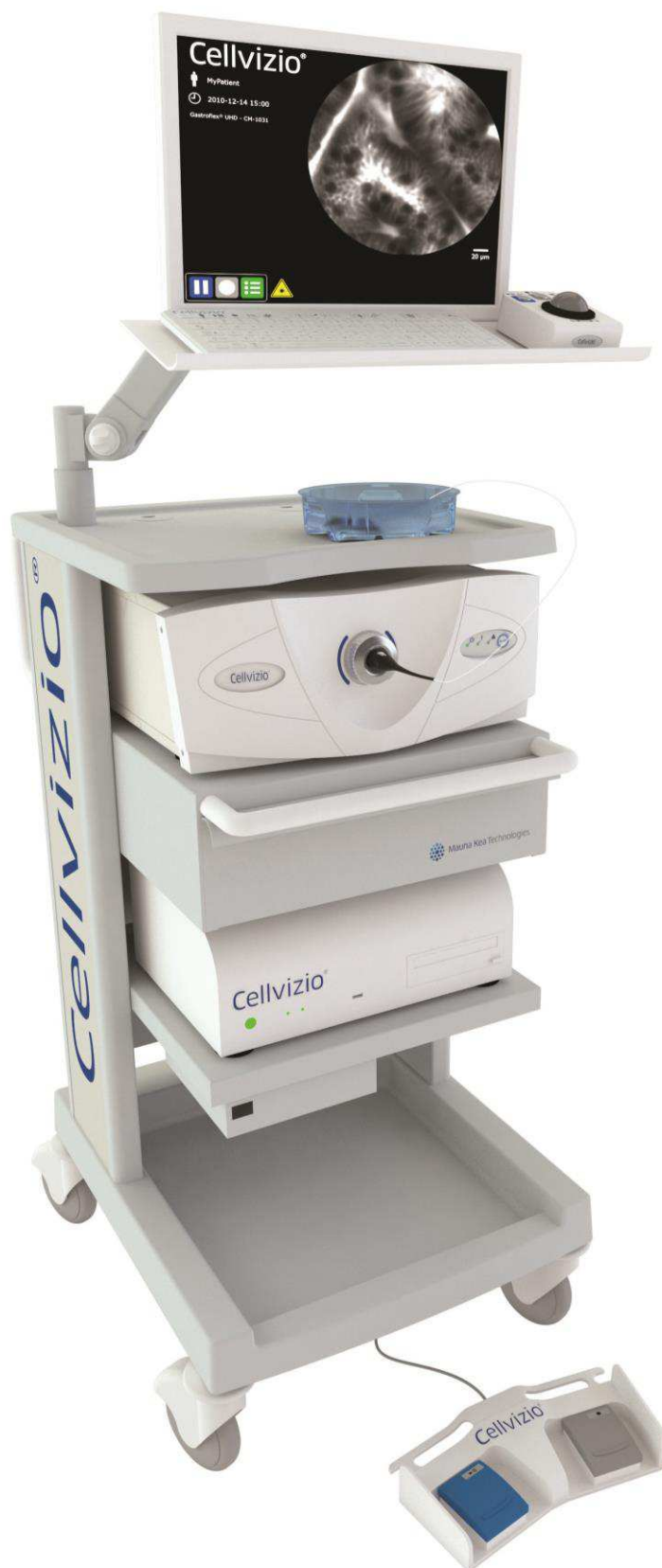
Obr. 1) Cellvizio® 100 Series