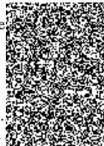
RNDr. Jan [redacted]