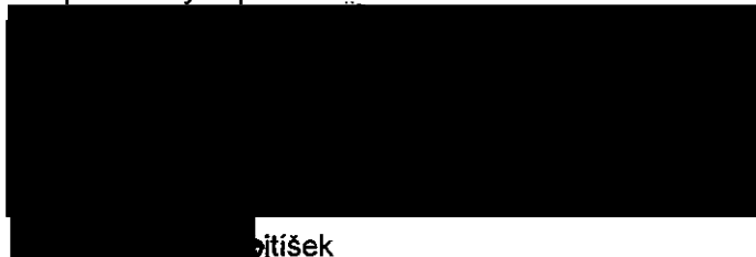
...tišek člen představenstva