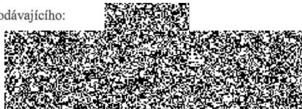
jednatel společnosti HELAGO-CZ, s.r.o