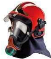
F1 SF 2