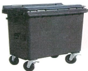
Plastový kontejner 660 l