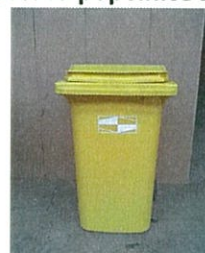
Plastová popelnice 240 l