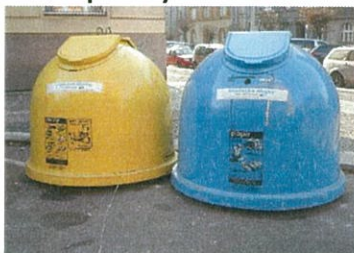
Odpadový zvon 2500 l