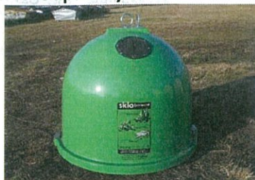
Odpadový zvon 1500 l