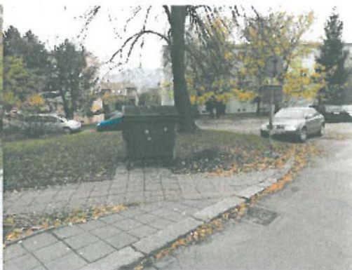
vedle kontejneru na komunál. odpad