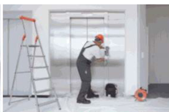
Servis 24 hodin