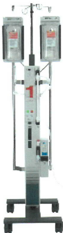
katalogové číslo: H-1025

Přístroj Level 1® Fast Flow je určen pro rychlý a bezpečný ohřev intravenózních roztoků. Systém Fast Flow je ideální nejen pro rutinní infúzi roztoků, ale i pro infúzi, kdy je potřeba ohřátou tekutinu podat ve velmi krátkém čase. Použití je jednoduché a bezpečné. Standardně se Systém Fast Flow využívá při ohřívání krve a roztoků během elektivních chirurgických výkonů, na jednotkách intenzivní péče a na jednotkách urgentního příjmu.