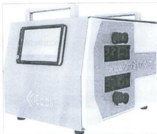
Obr. 1 – chladicí jednotka