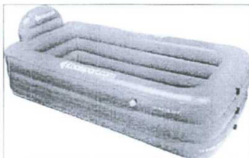
Obr. 2 - bazének