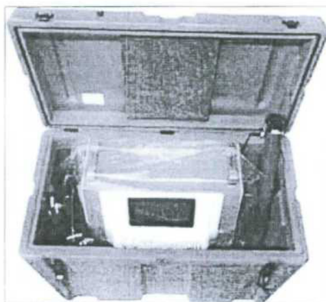
Obr. 3 - box sloužící k přepravě chladicí jednotky

Slouží pro bezpečný transport mobilních chladicích jednotek. Zabezpečené balení je zajištěno pouzdem Hard Travel, vyrobeným standardními vojenskými standardy. Tímto způsobem lze bezpečně přenášet a připojit chladicí jednotku a veškeré její užitečné příslušenství kdekoli do přenosné ledové lázně, nebo i vlastního malého bazénu.